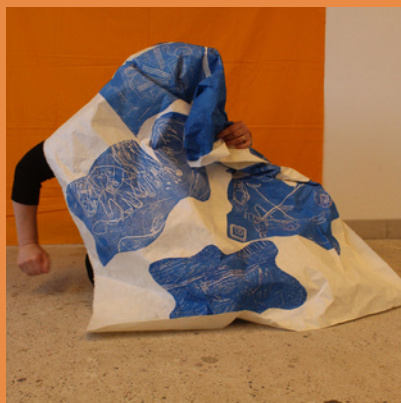
Photos issues d'ateliers de pratique artistique à la Corne d'or