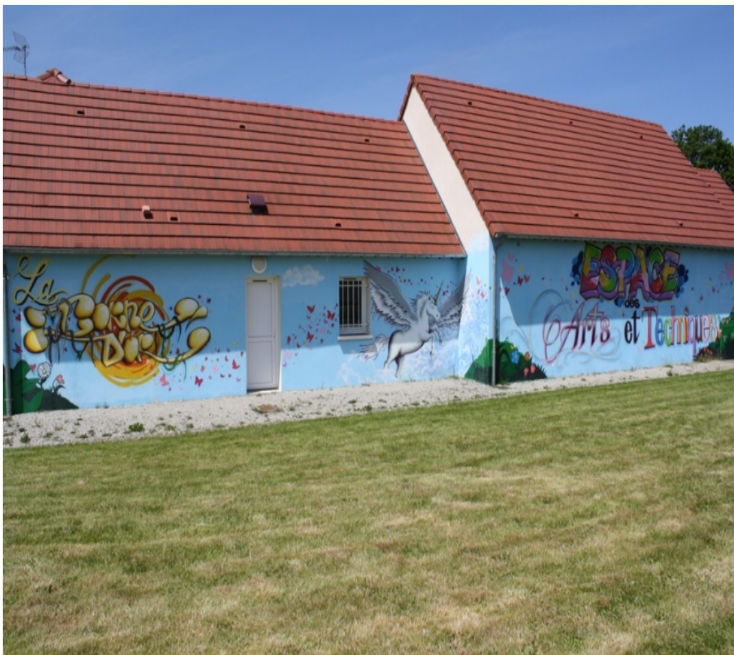
Espace des Arts, Structure culturelle